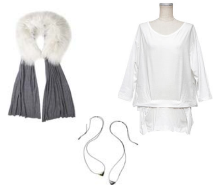
ストール(左上)、カットソー(右上)、 ネックレス(下)

ZOZOVILLAでは、TOGA、TOGA PULLA、TOGA ELASTIC、TOGA ODDS&ENDSといったラインを展開し、レディースウェアを中心にアクセサリやメンズアイテムなど様々な商品を取り揃えております。中心価格帯は、約30,000円、オープン時には約30型の型数で展開。また、ショップオープンを記念して、ファーストールや、ハイコットンジャージーカットソー、マジックトライアングルネックレスを限定で販売いたします。