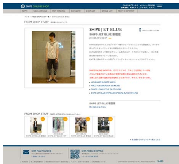
「FROM SHOP STAFF」イメージ