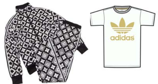
ZOZOTOWN 限定 セットアップ(左)とTシャツ(右)

アスリートのために生み出された歴史的商品を現代のファッションに蘇らせた adidas Originals(アディダス オリジナルス)を扱うショップです。トレフォイル(三つ葉)ロゴのオリジナリティ溢れるアイテムやスタイルを幅広く提案します。ZOZOTOWNでは、メンズ・レディース・キッズ共にウェアやスニーカーなど様々な商品を取り揃えています。中心価格帯は約 10,000 円、オープン時には約 250 型の型数で展開。ショップオープンを記念して、オリジナルTシャツとデザイナー・JEREMY SCOTT(ジェレミー・スコット)のセットアップを限定販売いたします。