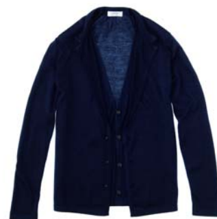
Zozotown 限定 カーディガン

本国パリ・ランバンのエッセンスを盛り込み、変わらないエレガンスを表現するブランド、ランバン オン ブルー。キーワードは、“シックで生意気 (CHIC et GAVROCHE)”。CHIC-それは優しいエレガンス。クチュールの精神が息づいた繊細なディテール、歴史と伝統に裏打ちされたクラシックな佇まいは、品格と自信に溢れています。GAVROCHE-それは生意気な遊び心。先駆的なトレンドを感じるデザインとモダンなアプローチで彩られた刺激的なスタイリングには、生意気な遊び心が満ちています。“CHIC”と“GAVROCHE”-相反する2つの要素がミックスされた、新しい価値観を提案するブランドです。Zozotown では、メンズウェアやアクセサリ、小物など様々な商品を取り揃えています。中心価格帯は約16,000円、オープン時には約60型の型数で展開。ショップオープンを記念して、オリジナルカーディガンを限定販売いたします。