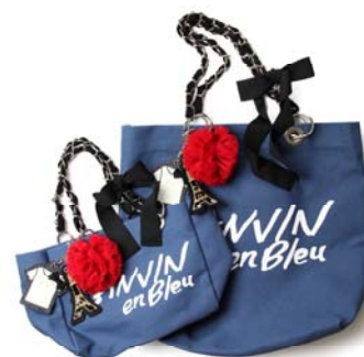
オリジナル トートバッグ

本国パリ・ランバンのエッセンスを盛り込み、変わらないエレガンスを表現するブランド、ランバン オン ブルー。キーワードは、“シックで生意気 (CHIC et GAVROCHE)”。CHIC-それは優しいエレガンス。クチュールの精神が息づいた繊細なディテール、歴史と伝統に裏打ちされたクラシックな佇まいは、品格と自信に溢れています。GAVROCHE-それは生意気な遊び心。先駆的なトレンドを感じるデザインとモダンなアプローチで彩られた刺激的なスタイリングには、生意気な遊び心が満ちています。“CHIC”と“GAVROCHE”-相反する2つの要素がミックスされた、新しい価値観を提案するブランドです。Zozotown では、レディースウェアやアクセサリ、小物など様々な商品を取り揃えています。中心価格帯は約20,000円、オープン時には約60型の型数で展開。ショップオープンを記念して、オリジナルトートバッグを販売いたします。