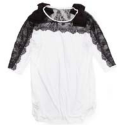
ZOZOTOWN 限定リボン付カットソー

ZOZOTOWNでは、レディースウェアやアクセサリなど様々な商品を取り揃えています。中心価格帯は約30,000円、オープン時には約50型の型数で展開。また、ショップオープンを記念して、リボン付カットソーをZOZOTOWN限定で販売いたします。