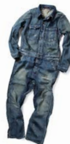
人気のエンジニアオーバーオール

ZOZOTOWN では、メンズ・レディース共にウェアやアクセサリなど様々な商品を取り揃えています。中心価格帯は約 20,000 円、オープン時には約 90 型の型数で展開いたします。