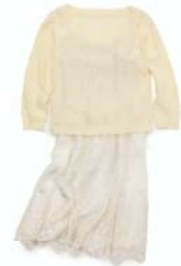
ZOZOTOWN 限定 ニットとキャミワンピースのセット

ZOZOTOWNでは、レディースウェアなど様々な商品を取り揃えています。中心価格帯は約15,000円、オープン時には約50型の型数で展開。また、ショップオープンを記念して、ニットとキャミワンピースのセットをZOZOTOWN別注カラーで販売いたします。