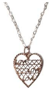
ZOZOTOWN 限定のチャームと ネックレスチェーンのセット

ZOZOTOWNでは、レディース向けにアクセサリを中心としたファッション雑貨など、様々な商品を取り揃え、中心価格帯は約12,000円、オープン時には約60型の型数で展開します。また、ショップオープンを記念して、K10 チャームと、K10 ネックレスチェーンをセットで販売します。チャームを通してチェーンとして使っていただけるピンクのサテンリボンとギフトBOXも数量限定でお付けします。さらに、NOJESSの商品を18,900円(税込)以上お買い上げの先着20名様にオリジナルジュエリークロスをプレゼントします。