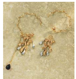
ZOZOTOWN 限定カラー 2009年Winter Limited ピアスセット

ZOZOTOWN では、レディース向けにアクセサリーを中心としたファッション雑貨など、様々な商品を取り揃え、中心価格帯は約25,000円、オープン時には約60型の型数で展開します。また、ショップオープンを記念して、大人気の2009年Winter Limited ピアスセット「09 WINTER LIMITED PIERCED EARRINGS SET」から ZOZOTOWN 限定カラーのブラックを数量限定で販売します。さらに、ageteの商品を26,250円（税込）以上お買い上げの先着20名様にオリジナルピルケースをプレゼントします。