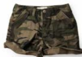
ZOZOTOWN 限定 ミリタリーショートパンツ

ZOZOTOWNでは、レディースウェアを中心に様々な商品を取り揃えています。中心価格帯は約8,500円、オープン時には約120型の型数で展開。また、ショップオープンを記念して、オリジナルミリタリーショートパンツを限定販売いたします。