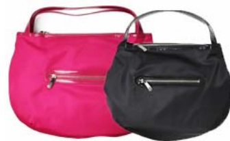
ZOZOTOWN 先行販売 右: バッグ(小) 左: バッグ(大)

ZOZOTOWNでは、メンズ・レディース共にウェアやバッグの他、キッズウェアなど様々な商品を取り揃えています。中心価格帯は約15,000円、オープン時には約450型の型数で展開。また、ショップオープンを記念して、オリジナルバッグを先行販売いたします。