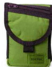
ZOZOTOWN 別注カラー ガジェットケース

ZOZOTOWNでは、バッグなどの小物類を中心に様々な商品を取り揃えています。中心価格帯は約25,000円、オープン時には約120型の型数で展開。また、ショップオープンを記念して、スマートフォンやデジタルカメラの収納にぴったりなガジェットケースのZOZOTOWN 別注カラーを販売いたします。