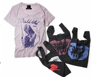
ZOZOTOWN 限定カラー T シャツ(左) エコバッグ(右)

ZOZOTOWN では、レディースウェアやアクセサリなど様々な商品を取り揃えています。中心価格帯は約 9,000 円、オープン時には約 100 型の型数で展開。また、ショップオープン記念として、WRIGHT×goocy(ライト×グースイー)コラボエコバッグと、museum neu(ミュージアムニュー)のレディースライン neuv(ニューブ)×goocy コラボ T シャツの限定カラーを販売いたします。