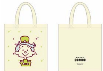
オープン記念プレゼントの トートバッグ

ZOZOTOWN では、メンズ・レディース共にウェアやアクセサリなど様々な商品を取り揃えています。中心価格帯は約 8,000 円、オープン時には約 60 型の型数で展開。また、ショップオープンを記念して、税込 10,500 円以上お買い上げの先着 50 名様に、トートバッグをプレゼントいたします。