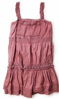
ZOZOTOWN 限定カラー ワンピース

ZOZOTOWN では、レディースウェアやアクセサリなど様々な商品を取り揃えています。中心価格帯は約 8,000 円、オープン時には約 50 型の型数で展開。また、ショップオープン記念として、mystic で人気のワンピースの限定カラーを販売いたします。