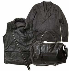
ZOZOTOWN 限定 ダウンベスト(左) ジャケット(右上) 2WAY レザーバッグ(右下)

ZOZOTOWN では、メンズ・レディース共にウェアやアクセサリなど様々な商品を取り揃えています。中心価格帯は約 20,000 円、オープン時には約 120 型の型数で展開。また、ショップオープンを記念して、ELMORE L.LEONARD(エルモアエルレナード)のシーブスキンダメージダウンベストとジャケット、L.H.P.の 2WAY レザーバッグを限定販売いたします。