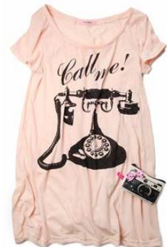
ZOZOTOWN 限定 デジカメケース付き プリント T シャツワンピース

ZOZOTOWN では、レディースウェア、シューズ、アクセサリなど様々な商品を取り揃えています。中心価格帯は約 10,000 円、オープン時には約 150 型の型数で展開。また、ショップオープンを記念して、プリント T シャツワンピースをデジカメケース付きで限定販売いたします。